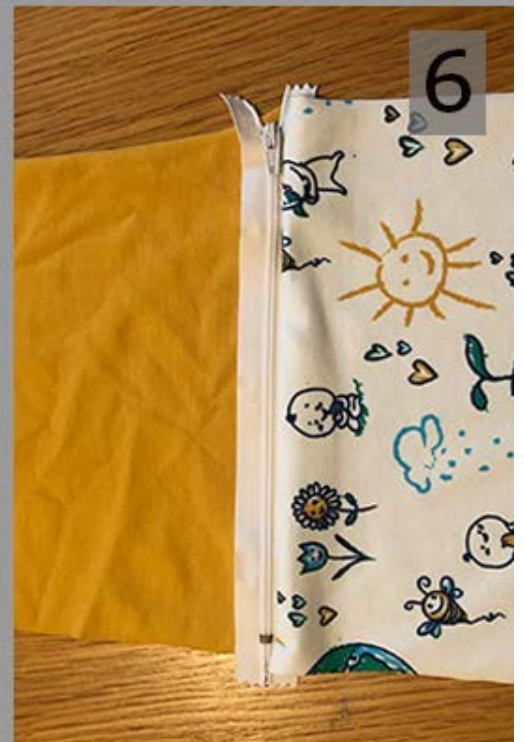
Het lijf van het zorgenvriendje ontstaat.